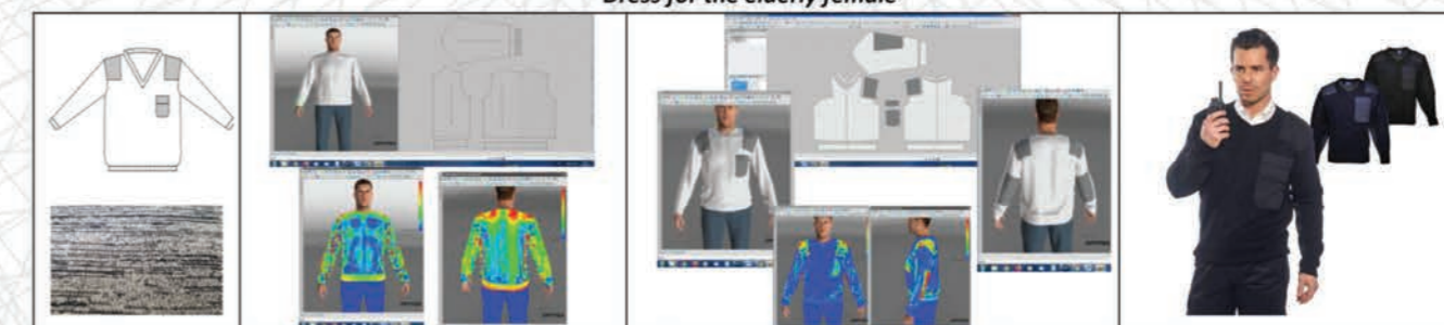
Sweater for operatives in defense/public order/security structures