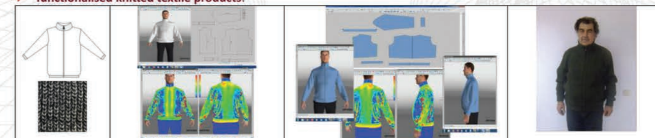
Jacket for elderly men